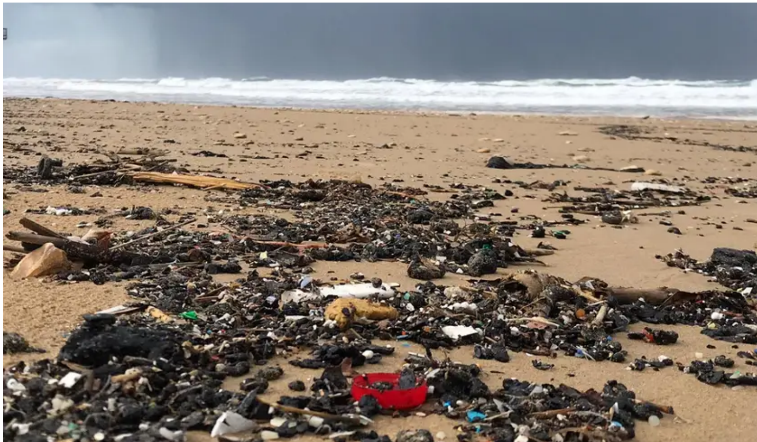
גושי זפת מול טירת הכרמל, בשבוע שעבר.